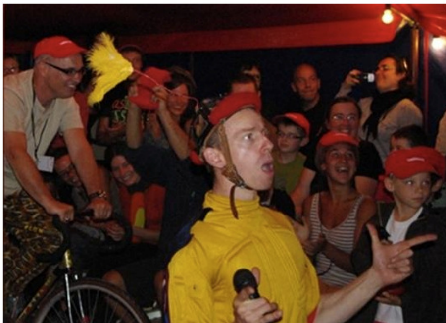
Le Tour de France, étape chalonnaise.

le 24/07/2011 à 05:00 par J.-M. G. Vu 3 fois